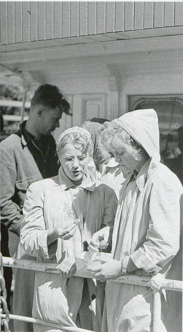
«Forventningsfulle og vitebegjærlige danske ungpiker.»