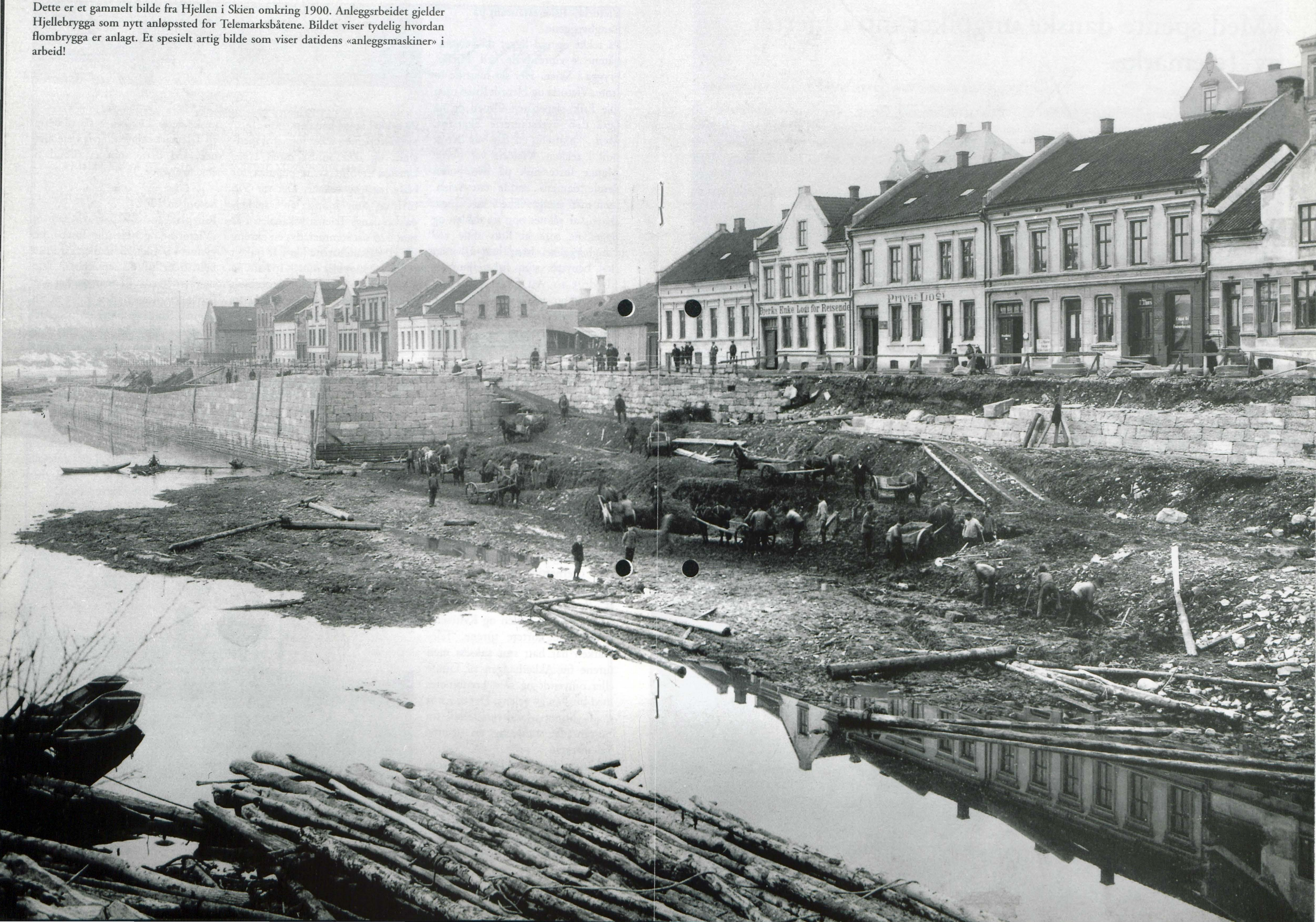
Dette er et gammelt bilde fra Hjellen i Skien omkring 1900. Anleggsarbeidet gjelder Hjellebrygga som nytt anløpssted for Telemarksbåtene. Bildet viser tydelig hvordan flombrygga er anlagt. Et spesielt artig bilde som viser datidens «anleggsmaskiner» i arbeid!