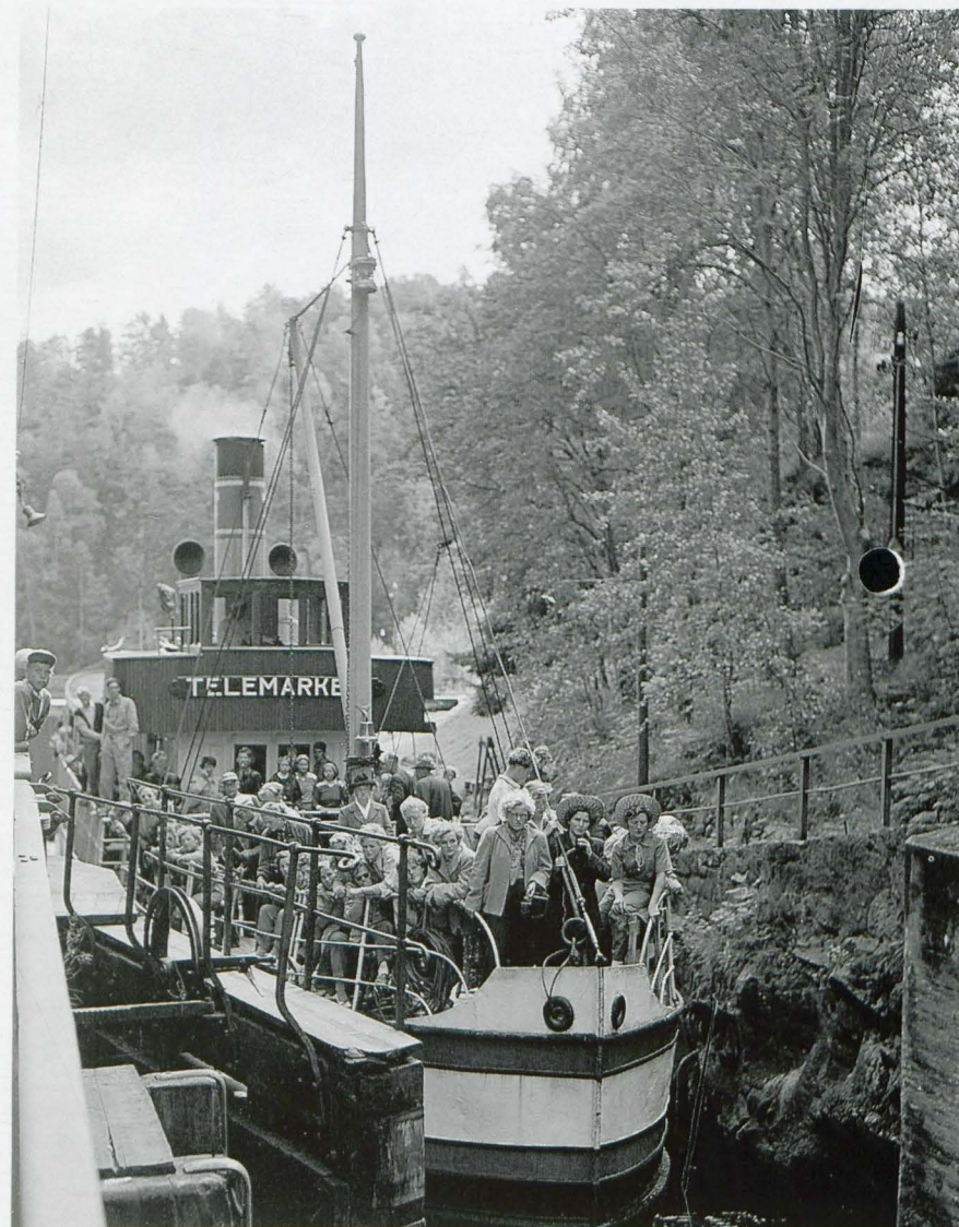
«Vi er ved slusene, og et nytt mysterium åpner seg for disse vitebegjærlige, unge danske pikene.» fra Løveid.