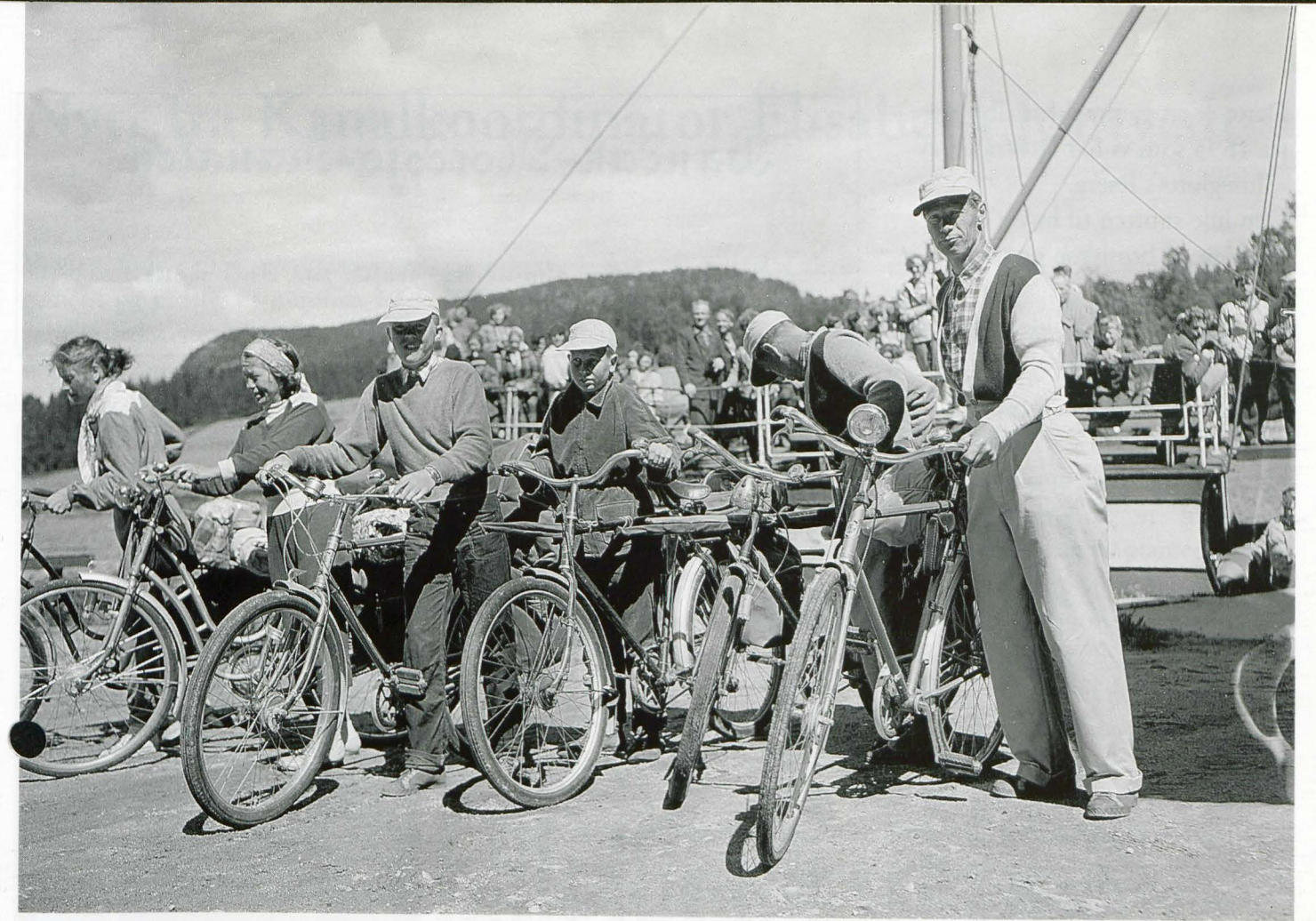
Sykkelturister på båten i 1950-årene.