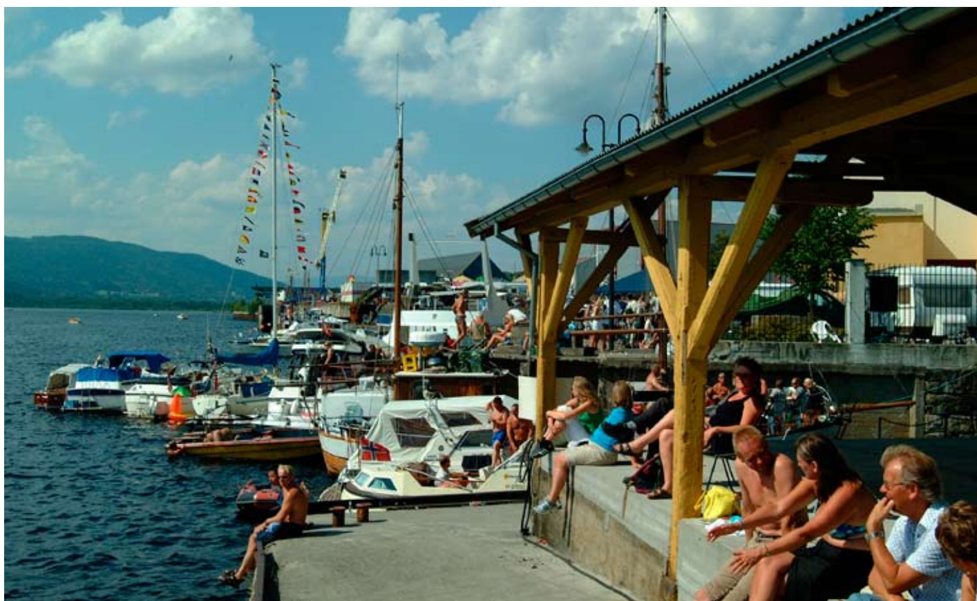
Fra brygga på Notodden under Bluesfestivalen.