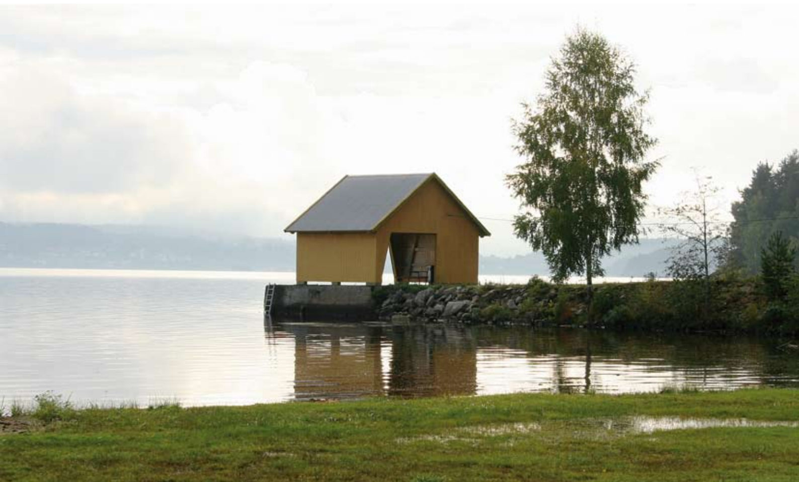
Valebø brygge. Foto: Helge Markussen, Skien. (Fra boken "På sporet av Elg-Johansen". Genius Forlag, Skien.

på annen måte. Dette må ha lyktes, for brygga sto ferdig året etter, og vedlikeholdet ble overtatt av Bryggefondet. Brygga ligger nær inntil et gårdsanlegg og har forbindelse til riksvei 36. Brygga er intakt i dag. Like nord for brygga lå Skiftenesodden fyrlykt.