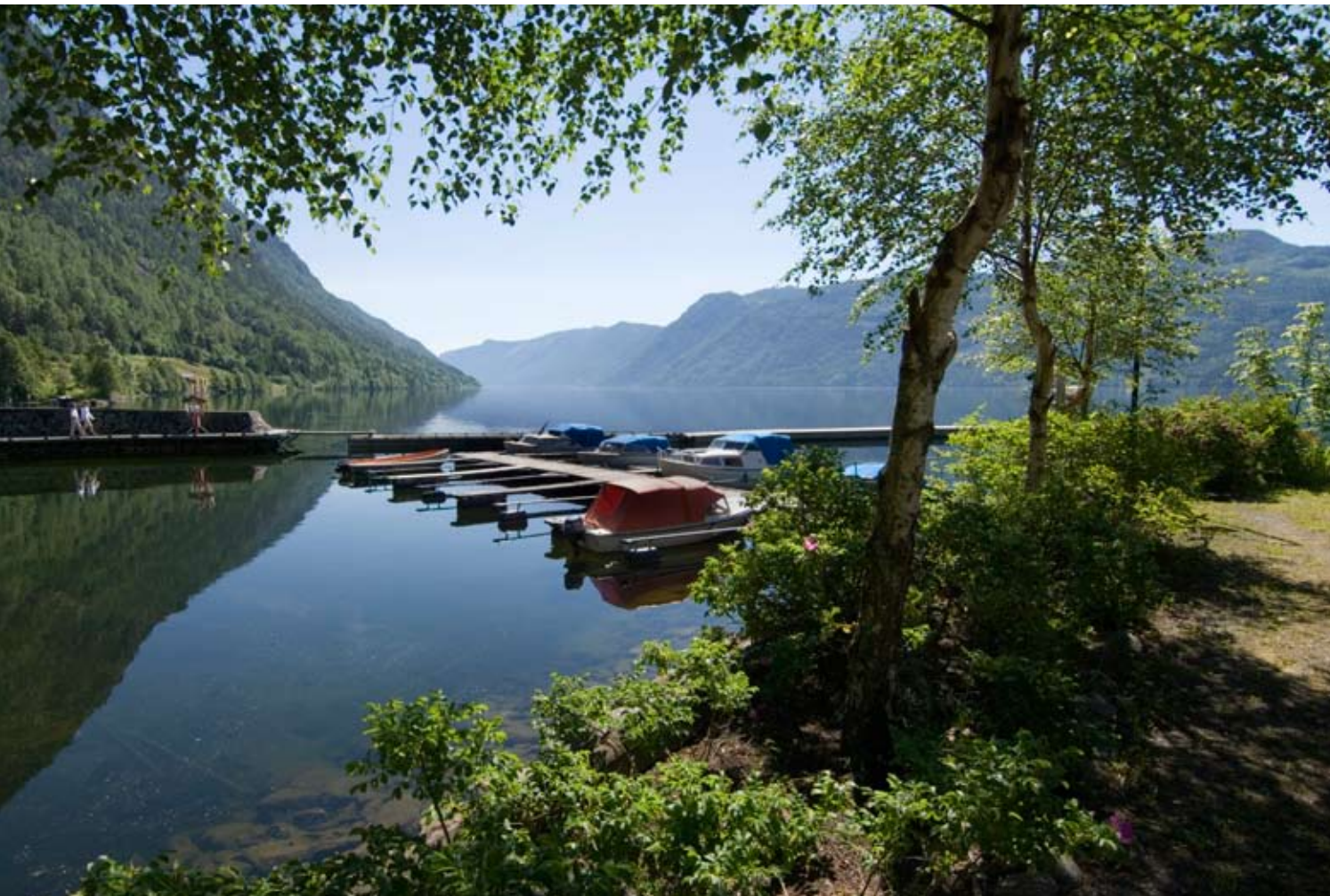
Idyll fra Dalen.

MD antydnet at det kunne være mulig å arbeide videre med et regionalparkprosjekt forankret i landskapskonvensjonen.