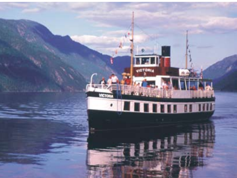
M/S "Victoria", "En dame i sin beste alder".

for Miljø og Bio vitenskap (Ås) og Aurland naturverkstad. Dette var ferdigstilt i 2008; og det ble i de seks kanalkommunene, i TFK og hos Fylkesmannen besluttet å gå videre med fra forprosjekt til et hovedprosjekt. Her skal man blant annet utrede følgende: