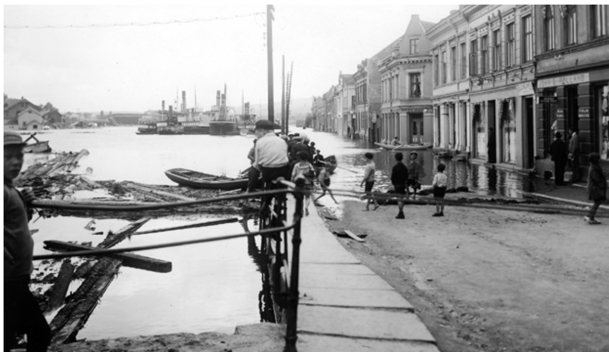
Nedre Hjellegt. fra flommen i 1927.