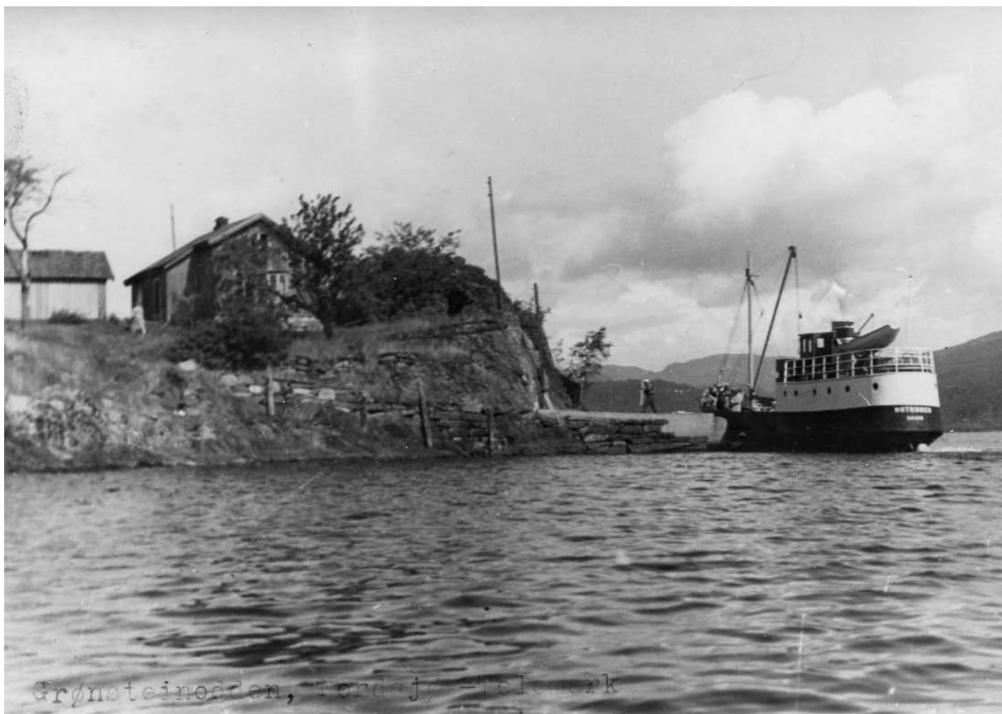
Grønstein brygge. (Fra boken "Hus i Holla II", kommer ut våren 2010.

"honnørbrygge" for Haakon VII i 1912. Det skal ha vært rød løper der når kongen gikk om bord med familie og følge på vei til Dalen med en flaggsmykket "Inland".